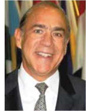
Angel Gurría Secrétaire général de l'OCDE

“ La qualité de l'éducation est l'atout le plus précieux des générations présentes et à venir. Elle exige l'engagement sans faille de tous : gouvernements, enseignants, parents et élèves. L'OCDE y contribue avec l'enquête PISA, qui suit l'évolution des résultats de l'éducation selon un cadre approuvé par tous qui se prête à des comparaisons internationales valides. En montrant que certains pays réussissent à allier équité et qualité, l'enquête PISA lance des défis ambitieux à d'autres pays. ”